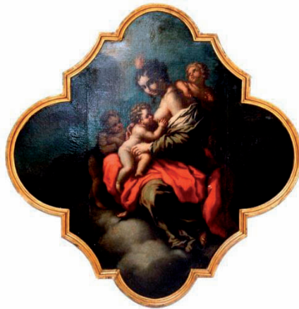
Dipinto ad olio raffigurante Madonna con Bambino e S. Giovanni - F. Giordano - sec.XVII- XVIII (Proprietà Cassa Forense)

La domanda deve essere presentata, a pena di decadenza, a decorrere dal compimento del sesto mese di gravidanza (26esima settimana di gestazione) fino al termine perentorio di 180 giorni dal parto.